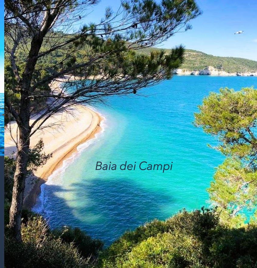
Baia dei Campi