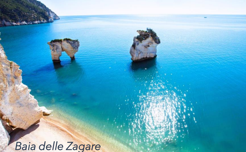
Baia delle Zagare