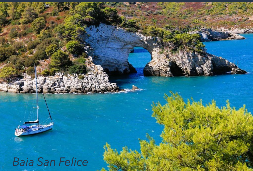
Baia San Felice